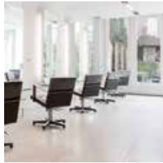
HAIR | MAKE-UP | BROWS KERKSTRAAT 75 DEN BOSCH