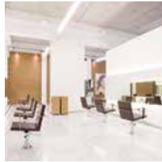
HAIR | MAKE-UP | BROWS LICHTTOREN 2 EINDHOVEN