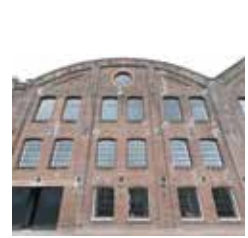
ROB PEETOOM FACTORY HAARLEMMEERSTRAATWEG 9 HAARLEM - HALFWEG