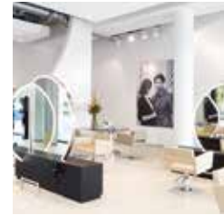
HAIR | MAKE-UP | BROWS GEORGE GERSHWINLAAN 536-538 AMSTERDAM - ZUIDAS