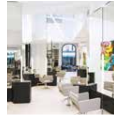
HAIR | MAKE-UP | BEAUTY | BROWS ZIJLSTRAAT 76 HAARLEM