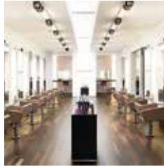
HAIR | MAKE-UP | BROWS ELANDSGRACHT 68 AMSTERDAM