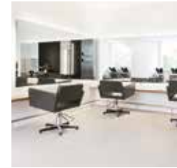
HAIR | MAKE-UP | BROWS JAN VAN GOYENSTRAAT 15 HEEMSTEDÉ