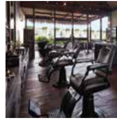
MR. PEETOOM THE BAR & BARBER PANTAI KUTA STREET BALI - BEACHWALK