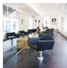
HAIR | MAKE-UP | BEAUTY - BROWS NOBELSTRAAT 18 UTRECHT