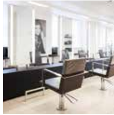
HAIR | MAKE-UP | BROWS DAM 1 - 5TH FLOOR DE BIJENKORF AMSTERDAM