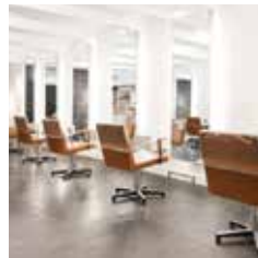
HAIR | MAKE-UP | BROWS NIEUWSTRAAT 13 HOORN