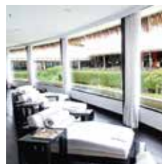
HAIR SPA PANTAI KUTA STREET BALI - BEACHWALK