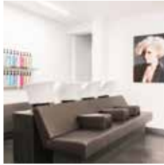
HAIR | MAKE-UP | BROWS RITSEVOORT 4 ALKMAAR