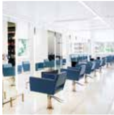
HAIR | MAKE-UP | BEAUTY | BROWS WAGENSTRAAT 32 - DE BIJENKORF DEN HAAG