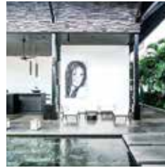
HAIR SPA PETITENGET 16 BALI - SEMINYAK