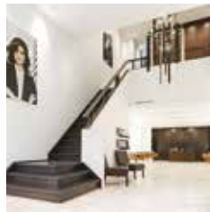
HAIR | MAKE-UP | BROWS MEENT 128 ROTTERDAM