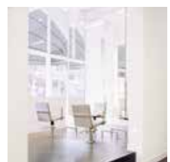
HAIR | MAKE-UP | BROWS LUCASBOLWERK 2 UTRECHT